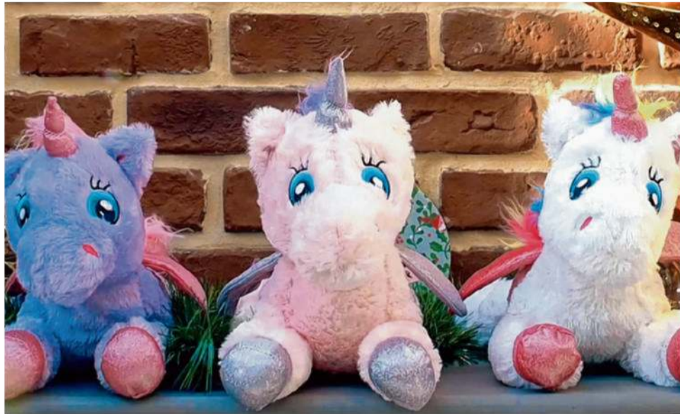
Flying Tiger Copenhagen : 1 peluche licorne achetée = 5 € reversés au Centre Oscar Lambret à Lille.

À l'approche en effet des fêtes de Noël, pour l'achat d'une peluche licorne à 10 €, Flying Tiger Copenhagen s'engage à reverser 5 € au COL.